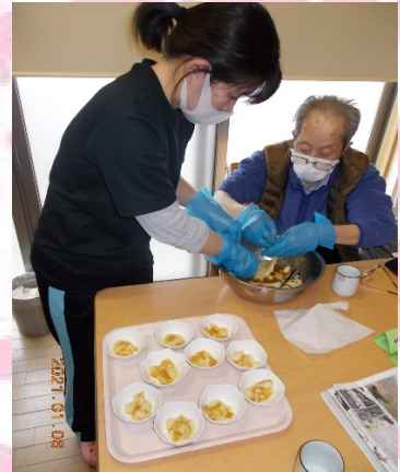
大根おろしは力持ちにお任せ♪