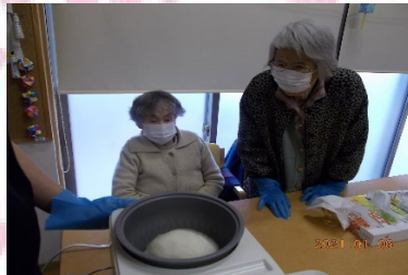
職員と力を合わせて共同作業！