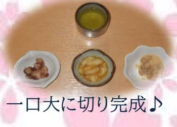
一口大に切り完成♪