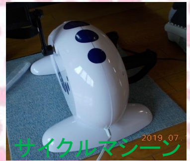
サイクルマシーン