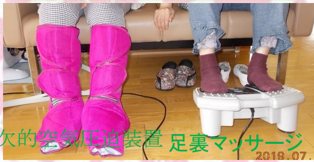
間欠的空気圧迫装置 足裏マッサージ